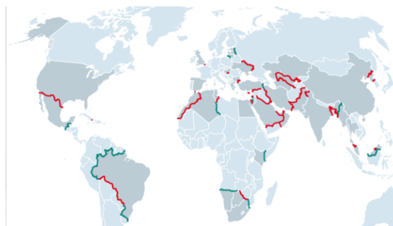
Slika 1: Zidovi in ograje na mejah po vsem svetu

Gradnja zidov ali ograj na državnih mejah velja za najbolj učinkovit in privlačen način, s katerim bi lahko države omejile nezakonito priseljevanje, izboljšale varnost in ponovno pridobile nadzor nad vstopom. Vendar pa so, kot kažejo empirične študije (Vernon in Zimmermann, 2019), stroški utrdb visoki, koristi pa vprašljive, saj ne zmanjšujejo migracij, tihotapljenja ali terorizma dovolj učinkovito. Čeprav so mednarodne migracije v porastu zaradi regionalnih konfliktov na Bližnjem vzhodu, naraščajoče neenakosti in naravnih nesreč po vsem svetu, še vedno le 3 % svetovnega prebivalstva živi zunaj svoje države rojstva. Kot kažejo študije, manj restriktivne migracijske politike in odprte meje državam prinašajo večje koristi, če jih spremljajo institucionalne spremembe, ki omogočajo integracijo migrantov_k na trg dela in v družbo.